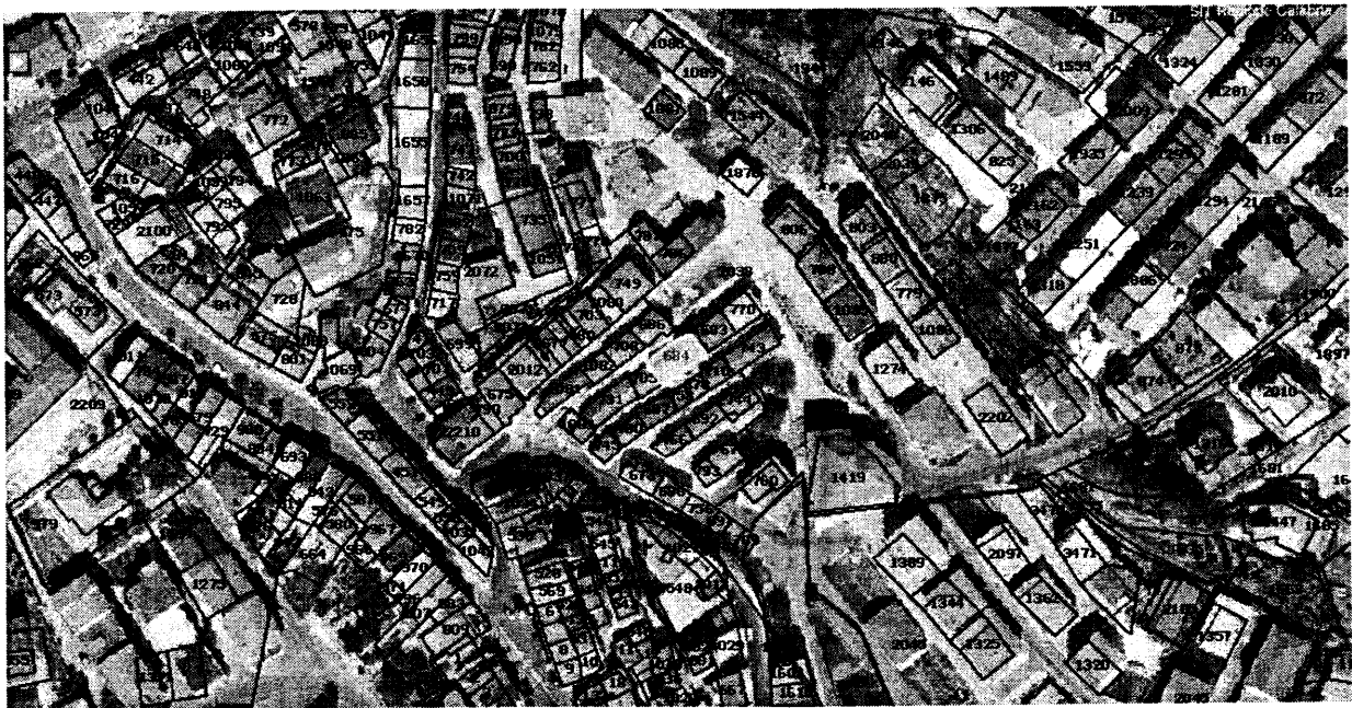
Foto localizzazione del Lotto n.1 dall'alto.