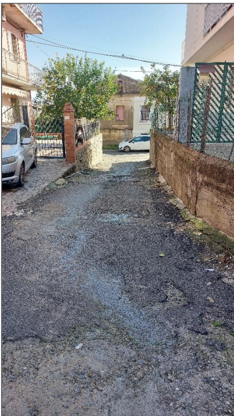
Strada di accesso all'immobile