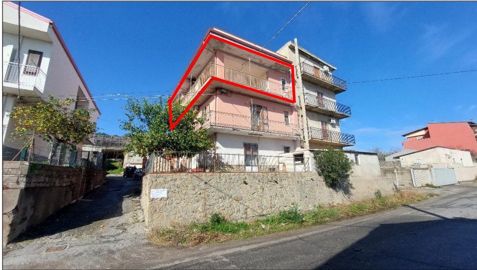
Immobile pignorato – Lato Sud Est