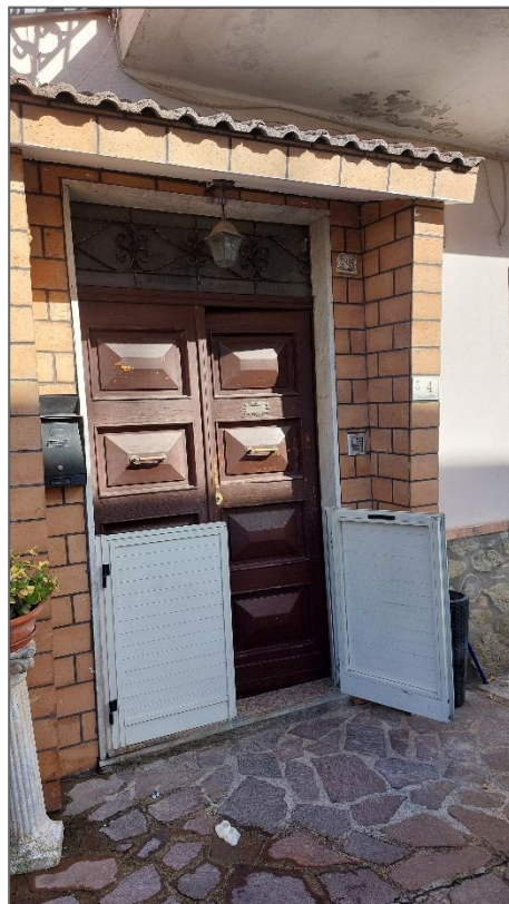
Portone di accesso all'immobile