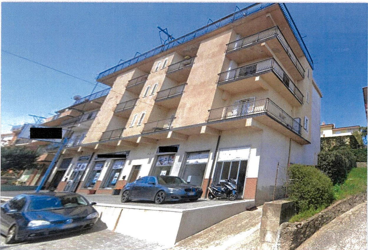
Vista esterna fabbricato - Via Nazionale

L'immobile posto al piano primo, confina con la via Nazionale a Sud, con la Via Borrelli a Nord, con via Borrelli ad Est, salvo altri.